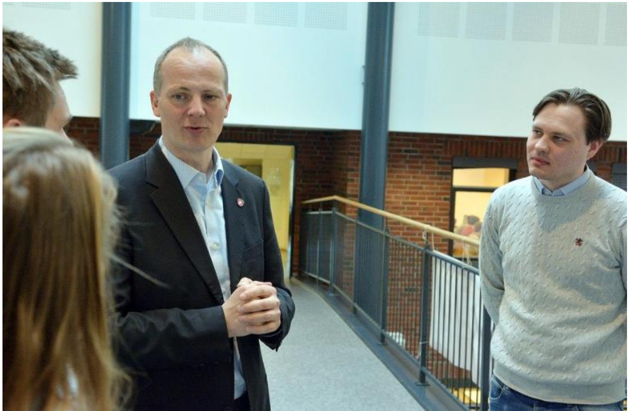
Samferdselsminister Ketil Solvik-Olsen i dialog med studenter.

– Studentprosjektene viser at både Nye Veier og universitetet har grepet sjansen til å produsere ny kunnskap. Prefabrikkering er et godt eksempel hvordan bransjen kan minimere risiko og spare penger, sier Solvik-Olsen.